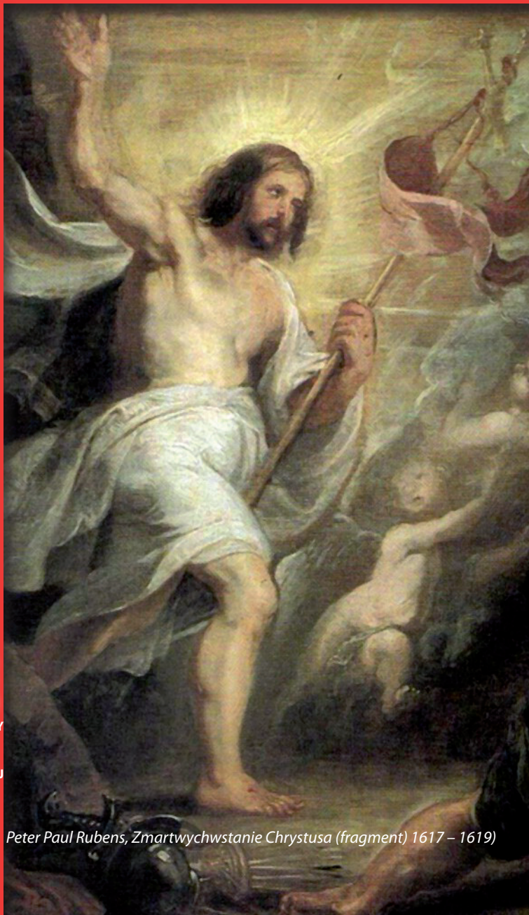
Peter Paul Rubens, Zmartwychwstanie Chrystusa (fragment) 1617 – 1619

PARAFIALNY ODDZIAŁ AKCJI KATOLICKIEJ SEJNY