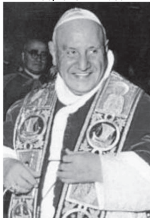
Jana Pawła II.

Wyjątkowym wydarzeniem będzie to, że kanonizacja bł. Jana Pawła II odbędzie się wraz z ogłoszeniem innego wielkiego Papieża – bł. Jana XXIII. Szczęśliwe połączenie kanonizacji obu Papieży z całą pewnością znajduje punkt wspólny w Soborze Watykańskim II. Jan XXIII, Papież, który otworzył