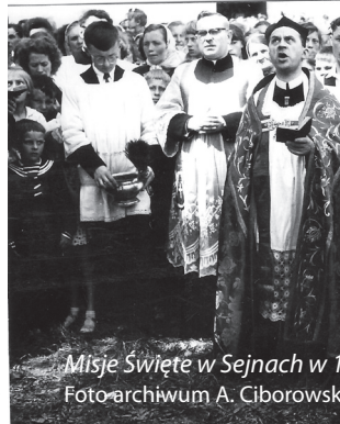
Misje Święte w Sejnach w 1998 r.

Coraz bliżej rozpoczęcie peregrynacji Świętego Wizerunku Nawiedzenia Matki Bożej Jasnogórskiej w naszej Diecezji: rozpocznie się 21 września br. w konkatedrze św. Aleksandra w Suwałkach. W naszym dekanacie nawiedzenie rozpocznie się w Puńsku, 11 października, do naszej Parafii Matka Boża Jasnogórska przybędzie 12 października, w sobotę, następnie do Smolan w niedzielę, 13 października, następne parafie to: Krasnopol, Berzniki, Karolin i Giby. W każdej parafii Obraz będzie jedną dobę; powitanie około godz. 17.00 i pożegnanie następnego dnia około 16.00. Od kilku miesięcy trwa Nowenna przygotowująca nas do tego wydarzenia. Wymiar duchowy jest tu najważniejszy, od