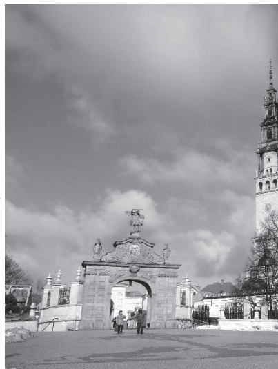
Sanktuarium Matki Boskiej Częstochowskiej

Przez wieki myśmy szli do jej tronu. Z różnych stron Polski szły w pobożnych pielgrzymkach wszystkie stany. Oddawali się pod Jej opiekę rządzący, królowie i poddani, uczeni i ludzie prości. Aż po dziś dzień ciągną na Jasną Górę niezliczone rzesze pielgrzymów, nie zważając na trud i zmęczenie, aby tylko oglądać łagodne oblicze swej Matki niebieskiej, serce pokrzepić wiarą i z nowymi siłami i otuchą wracać do domu. Któż z nas nie doświadczył tych radosnych przeżyć w Częstochowie, w kaplicy Matki Boskiej Jasnogórskiej. Jak żywo były serca nasze, gdy na dźwięk fanfar odśpiewało się z