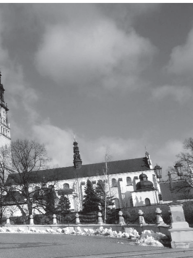
na Jasnej Górze

Teraz my czekamy na Ciebie, nasza Matko i Królowo. W swojej pielgrzymce odwiedzisz i naszą parafię, bo chcesz przyjrzeć się naszym wysiłkom, trud-